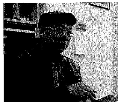
▼海外升學專家魯思指出，毋須擔心歐洲大學學歷不獲僱主認可。